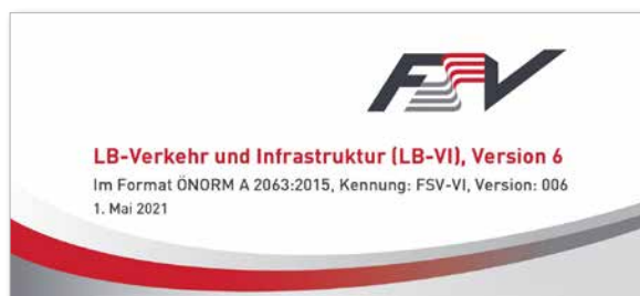
Leistungsbeschreibung Verkehr und Infrastruktur (LB-VI) Version 6